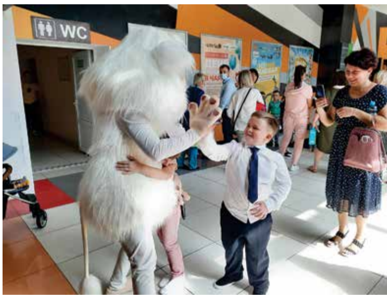
Анимационного Бубу полюбили все первоклашки