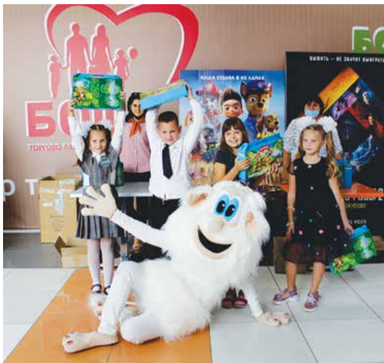
Ребята были довольны подарками от профкома ОЭМК

– Мне сейчас 22 года, но я помню, как мы в свое время тоже ходили от профкома в кинотеатр «Бель», нам показывали мультики и дарили сладкий подарок, – рассказала старшая сестра. – Тогда отмечали с меньшим размахом, а сегодня детям