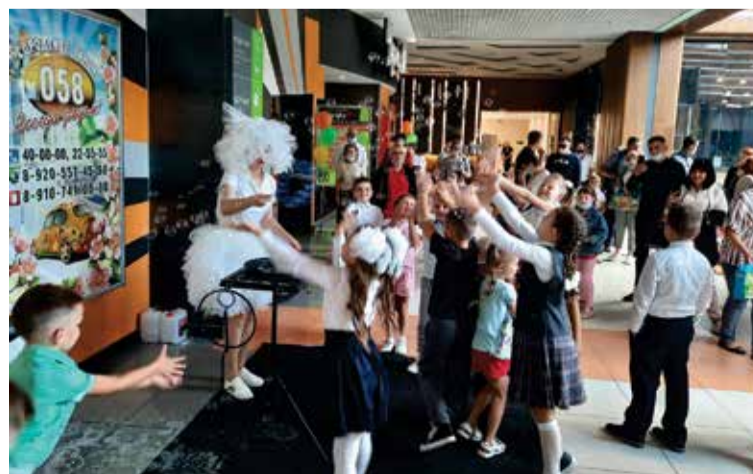
Шоу мыльных пузырей